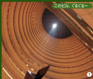
このビル、ぐるぐるー