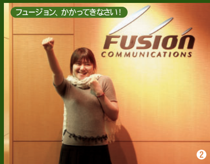
フュージョン、かかってきなさい!