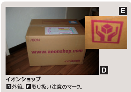
イオンショップ D 外箱。E 取り扱い注意のマーク。