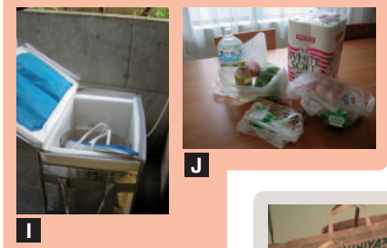
西友ネットスーパー I 玄関までクーラーボックスに入れてきてくれる。J 卵やトマトもエアパッキンで梱包。