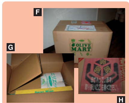
オリーブマート F 日用品の外箱。G ダンボールの切れ端が折り曲げて入れられ、中身が動かないように固定されていた。H 生鮮食料品はお菓子の空き箱を利用して、割れ物注意以外に「卵が入っています」というステッカーも貼られていた。