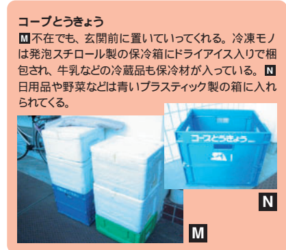
コープとうきょう M 不在でも、玄関前に置いていってくれる。冷凍モノは発泡スチロール製の保冷箱にドライアイス入りで梱包され、牛乳などの冷蔵品も保冷材が入っている。N 日用品や野菜などは青いプラスチック製の箱に入れられてくる。