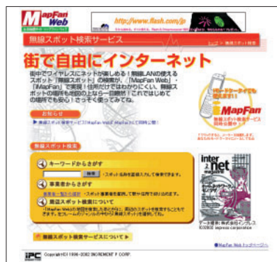
「MapFan Web」の無線スポット検索サービスのページ。 URL www.mapfan.com/musen/