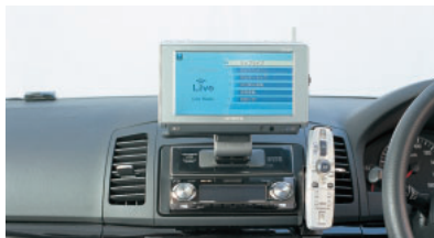
パイオニアのカーナビ「AirNavi」。国内初の通信機能内蔵カーナビだ。価格は月額3,980円(ボーナス時15,000円)など、さまざまなプランがある。 www.air-navi.com

「iMapFan」で、無線スポットを検索してそれをカーナビに表示。目的地に設定して、ナビゲーションに従って、無線スポットまで行くという使い方もアリだ。