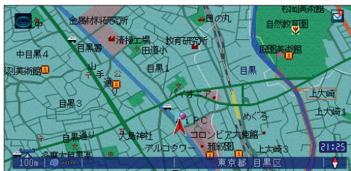
「ここです!メール機能」を使えば、「iMapFan」で検索した無線スポット情報を、カーナビに表示することが可能!