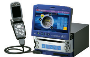
クラリオンの「AutoPC CADIAS」。日本で初めての車載PCで、OSにウィンドウズCE for Automotiveを採用。価格は338,000円。 www.cadias.addzest.com