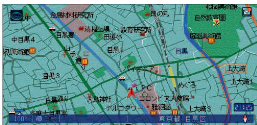
「ここです!メール機能」を使えば、「iMapFan」で検索した無線スポット情報を、カーナビに表示することが可能!