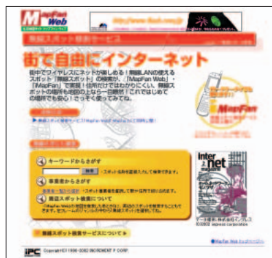
「MapFan Web」の無線スポット検索サービスのページ。 URL www.mapfan.com/musen/