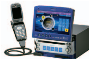
クラリオンの「AutoPC CADIAS」。日本で初めての車載PCで、OSにウィンドウズCE for Automotiveを採用。価格は338,000円。 www.cadias.addzest.com