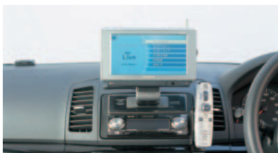
パイオニアのカーナビ「AirNavi」。国内初の通信機能内蔵カーナビだ。価格は月額3,980円(ボーナス時15,000円)など、さまざまなプランがある。 www.air-navi.com

「iMapFan」で、無線スポットを検索してそれをカーナビに表示。目的地に設定して、ナビゲーションに従って、無線スポットまで行くという使い方もアリだ。