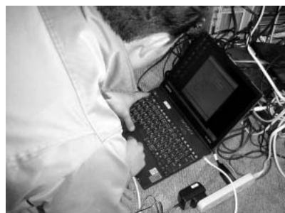
すべての工事が終わったところで、担当者が実際に接続チェック。なんとスピードは60Mbpsオーバー!