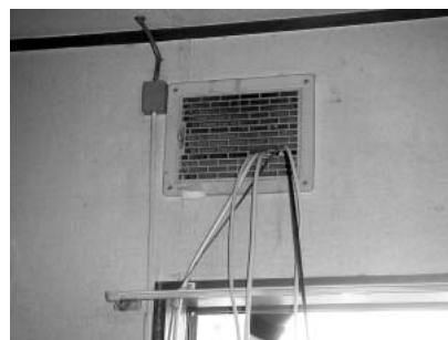
ファイバーは換気口から室内へ。しかし他の線もぎっしりで、もはや換気の役目は果たせそうにない。

以来、約1か月半ほど使用しているが、スピードについては文句なし。回線が切れたりすることもなく、安定性も抜群。料金はADSLを使っていたときの倍以上(月額5,700円)だが、この快適さを考えれば安いもの。とはいえ、主に使っているのはノートパソコン、接続は無線LAN(802.11b)経由なので、実はあまりこの快適さを体感する機会が少ないままになっている。これではいけない。家にPPTPサーバーを立てて、無線は802.11aにして……と、月額料金以上にまたムダ使いが多くなりそう。これはこれで実に困ったものだ。