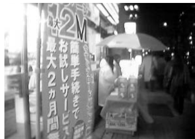
都内でもあちこちで見られるYahoo! BBのモデム配布キャンペーン。電話の安さで受け取る人も多いようだ。