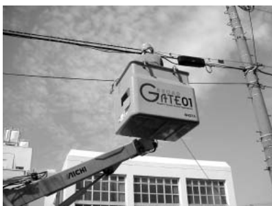
いよいよ工事開始。すでに引っ張られている光ファイバーを、分岐させて家まで引き込む。