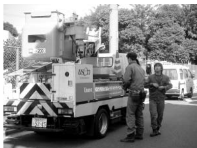
待ちに待ったusenの工事車両がついに我が家にもやってきました。夢のFTTH生活までついにあと一歩。