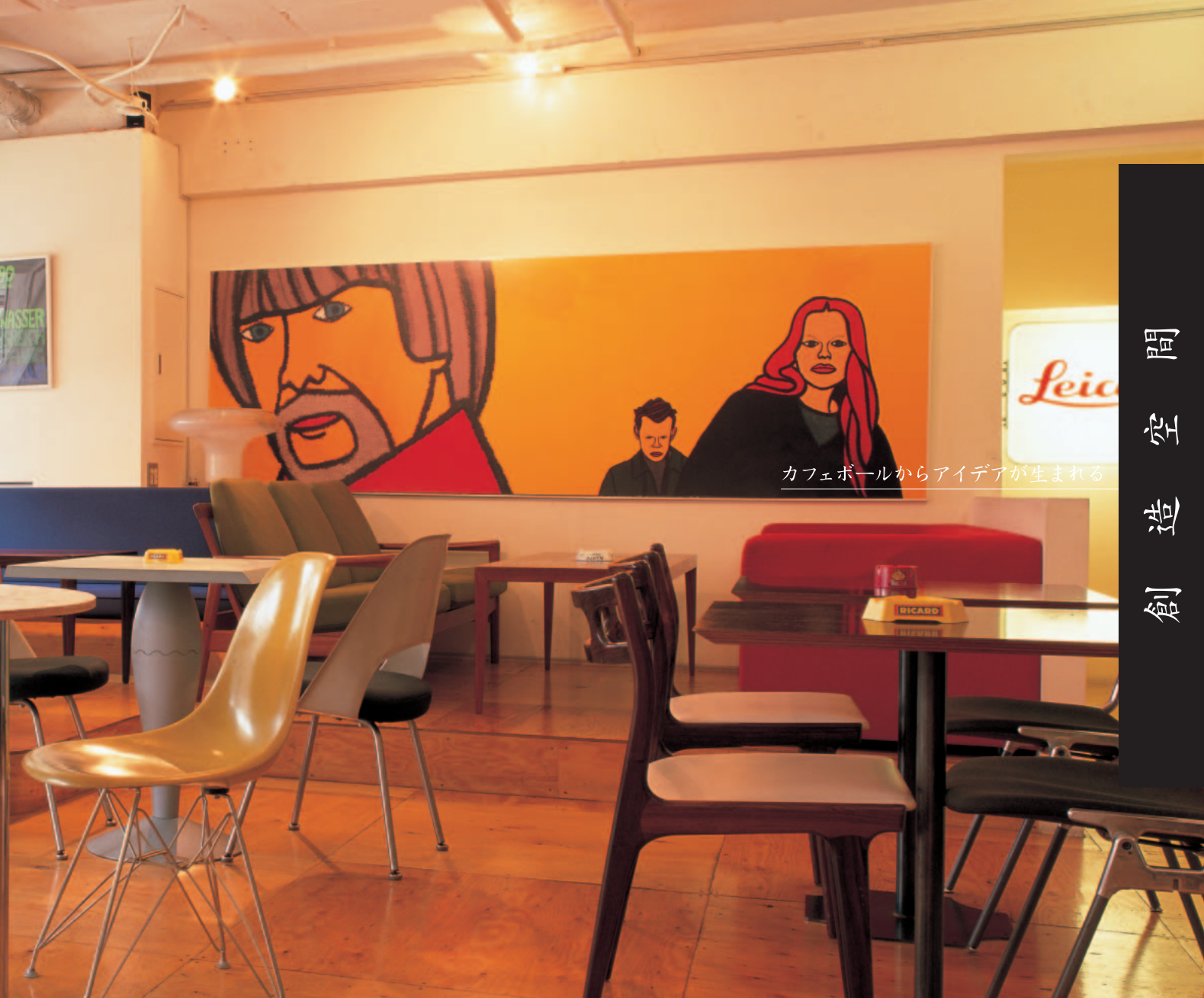
カフェボールからアイデアが生まれる