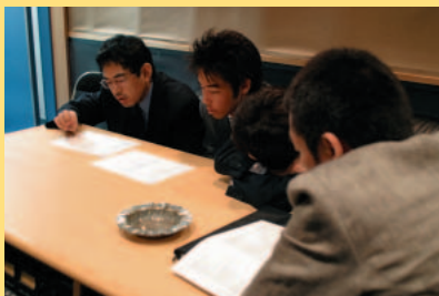
(左)収録される大阪弁について議論する、リアル登場人物たち。何度も収録し直すことで、上のリストとは微妙に違った言葉になっている。そのあたりも実際「自分育てゲーム」にコールして確認してほしい。