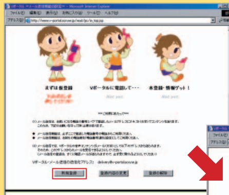
メール送信機能の登録画面で「新規登録」をクリック

Jump 01 www.ccn-ch.com/kuruma/ Jump 02 telme.vp.taito.co.jp