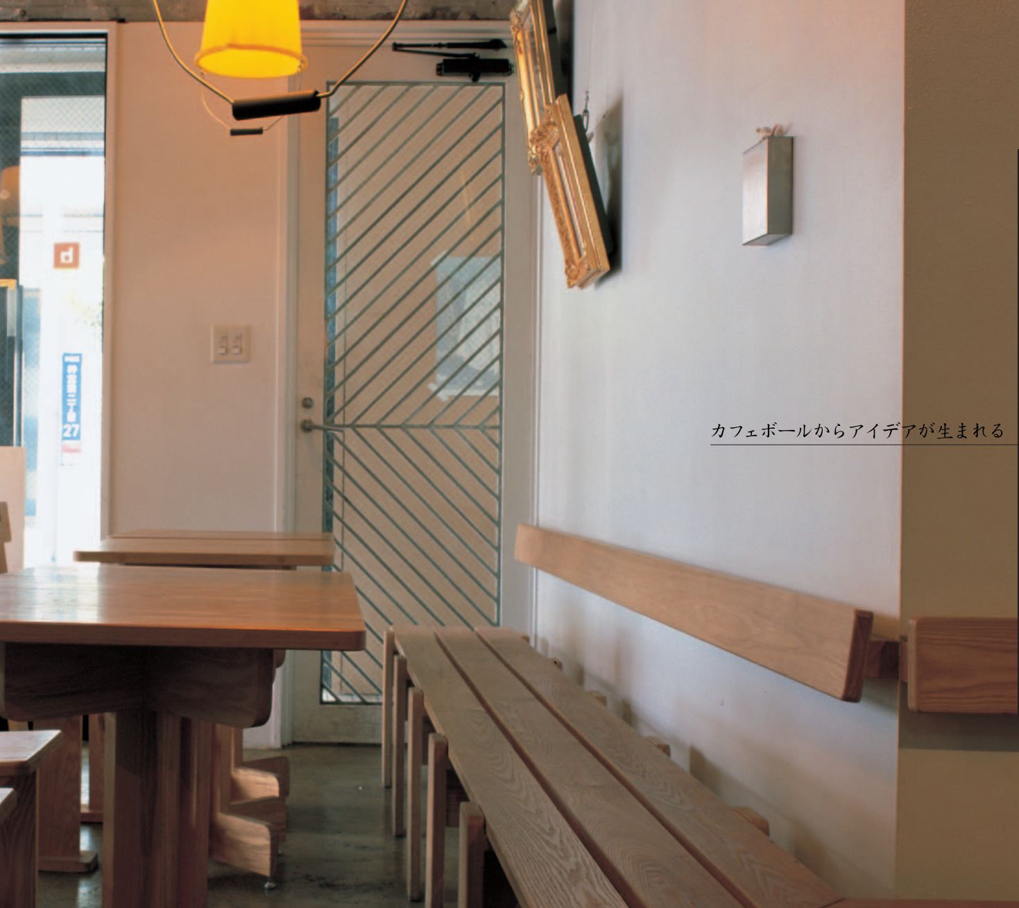
カフェボールからアイデアが生まれる