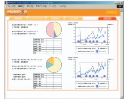
ソニー銀行が提供する「MONEYKit アドバイスエンジン」

最後に「相談機能」は、専門家に対して運用に関する質問などを相談できるサービスだ。電話だけではなく、最近ではオンライン顧客を対象にして電子メールでの相談を受け付ける金融機関も増えている。