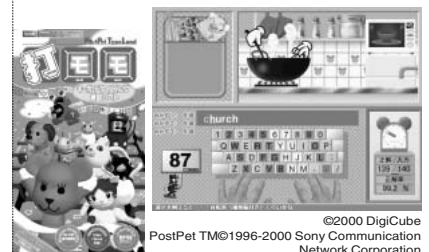
©2000 DigiCube PostPet TM©1996-2000 Sony Communication Network Corporation