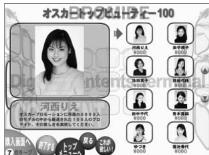
プロマイド購入画面