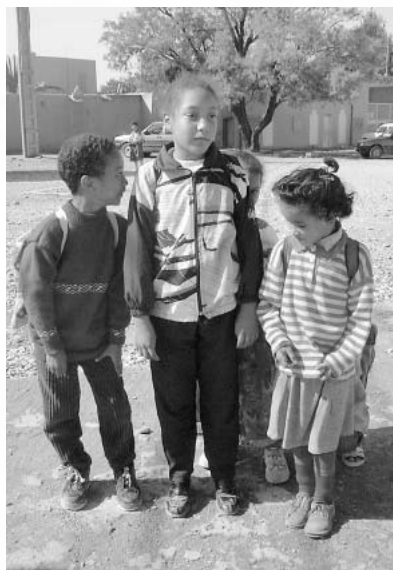
サハラ砂漠の手前の町エルラシディアの子供たち。遠くから全速力で走ってきて握手を求められた。

の皮が山と積まれて圧巻です。うっかり階段で滑った私を受け止め、手を引いてくれた彼の態度は紳士そのもの。時計が止まったといえば修理屋に連れていってくれ、現金が足りなくなったといえば両替に連れていってくれ、あまりの親切さに、彼を疑った自分を恥じるぐらい。翌日は手に「ヘナ」という草の粉で模様を描いてもらったり、トルコ風蒸し風呂「ハمام」へ連れていってもらったり。この「ハمام」は観光用のこざいいな店と違って、見ただけで目が破傷風になりそうな環境でしたが、連れてきてもらって文句も言えません。まな板に載ったつもりでぬるりと横になると、風船のようなお乳を下げたおばさんと、つららを下げたおばあさんが、寄ってたかって旅の汚れを落としてくれました。揺れる風船の下、靴下のようなアカすり袋で全身をこすられてるときの私の胸中、至福といったらよいやらこの世の終わりと云ったらよいやら。ま、ソレはともかく、風船責めとつらら責めが終わったあとは、なにやらサッパリしたもんです。さて「ハمام」も「ヘナ」も彼が支払いをしてくれて、「いくらだった？」って聞いても、なぜだか教えてくれません。払ってくれちゃうつもりなのかしら。でもそのあと彼が「安いよ」って連れていってくれたおみやげ屋は実際にはとっても高く、半量ぐらいのウールの敷物が3万円から5万円！ これってコミッション稼ぎをする客引きのパターンそっくり。なんか変だな？ と思い始めました。そして2日目の晩、彼の実家で夕食に呼ばれたあとのこと。「ハمامとヘナの代金を払うから」って言ったら、彼はなんと、私の泊まってるホテルの9泊分もの金額を紙に書いてみせたのです。友達が欲しいなんてウソだったんだ！ 気づいて青ざめたけどもう遅い。ここは迷宮のど真ん中。いま逃げ出しても帰り道がわかりません。持ち合わせがないからと、とりあえずホテルまで送って