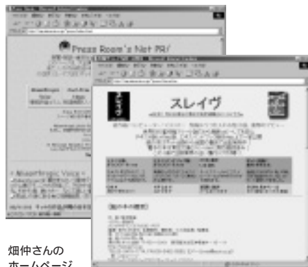
畑仲さんの ホームページ 「Press Room」中に「スレイヴ」のページがある。 URL http://ing.alacarte.co.jp/~press/

< Interview & Text by 鈴木康之 > URL http://www.asahi-net.or.jp/~ hh5y-szk/