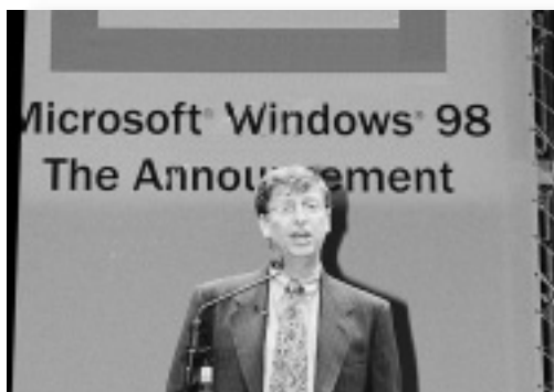
製品発表の挨拶を行う会長兼CEOビル・ゲイツ氏

テレビのデジタル化が進み、光ファイバーやCATVなどの新しい通信インフラが整う時代は近い。法的問題や企業のあり方の問題など、能天気喜んでばかりいられないのは事実だが、ウィンドウズ98がユーザーにどんな世界を見せてくれるのかをイメージするのも悪くはなさそうだ。