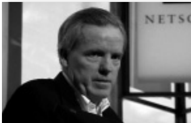
社長兼CEOジム・パークスデール氏

これら3つの要素によって、ターゲットは大企業から中小企業、さらにはネットセンターのメンバーである消費者までを網羅