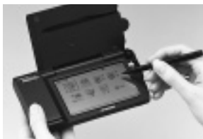
付属のタッチペンで簡単に操作できる