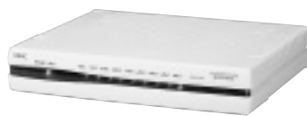
ナンバーディスプレイにも対応

URL http://www.nec.co.jp/japanese/today/newsrel/9806/0201.html