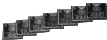
高画質のデジタルカメラでも大量の写真が撮れる