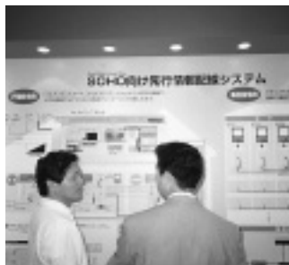
松下電工が展示したSOHO向け情報配線システム

今回のN+Iを通じて見てとれるのは、日本企業がインターネット技術を使ったネットワークを、ビジネスのインフラとして本格的に活用し始めたことだ。VoIPシステムやセキュリティ関連製品に対する注目の高さからも、ネットワークを運用する企業がネットワークに真剣に取り組んでいることや、そこから生じる具体的なニーズ(コスト削減や危険防止など)がうかがえる。情報通信分野で日本は米国にくらべて数年遅れているといわれているが、企業にとって重要なのはインフラの整備や質ではなく、顧客の満足を得られるサービスや製品の提供だ。今後は、今回発表されたようなさまざまなネットワークコンピューティング技術で完全武装した日本企業が、インターネットというボーダレスな競争舞台の上で、これから手掛けていこうとする新たなビジネスの展開にも注目したい。