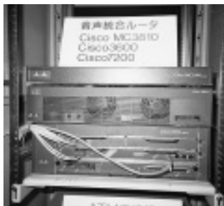
日本シスコシステムの音声統合ルーター群