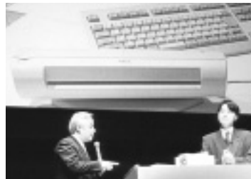
ウィンドウズ98のデモを行う古川享会長

この日、ウィンドウズ98のデモを行った古川享会長は、同OSの「USB」と「IEEE 1394」の対応によってPCとその周辺機器はより家電に近づく」と主張した。ドライバーやアイロンのように、PCの周辺機器