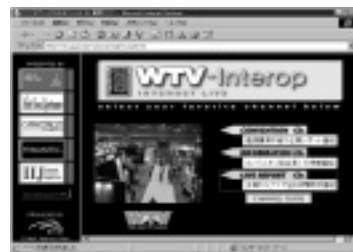
インターネット上に配信された会場の様子

また、「SECURE ID」のようなワンタイムパスワードカードを使ったファイアウォールなどのセキュリティ関連製品の出展も目立った。こうした製品を展示する企業のブースでは、現在のインターネットに潜む危険性と、その危険から重要なデータを守る自社の製品の優位性をアピールするためのデモがいたるところで行われ、多くの人が熱心