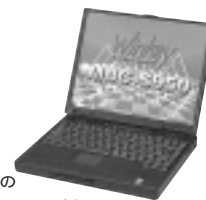
厚さ41ミリ、2.9グラムのボディーでモバイルPentium を採用

URL http://www.infosys.sanyo.co.jp/winkey/