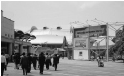
3日間で99,322人を集めた「NETWORKL + INTEROP 98 TOKYO」

会場では、日本ルーセント・テクノロジーや富士通などが、このギガビットイーサネット対応のルーターやハブ、スイッチを出展した。こうした製品の多くはイーサネットやファーストイーサネットのインターフェイスも併せ持ち、既存のネットワーク環境のギガビットイーサネットへの移行が容易になるよう配慮されている。またギガビットイーサネットのPCIカードも、日本サン・マイクロシステムズなどいくつかのブースで展示されていた。パーソナルユース製品の登場で、ギガビ