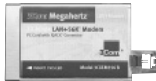
写真の10 + 56KモデムPCカード日本語版は6月下旬に出荷開始予定