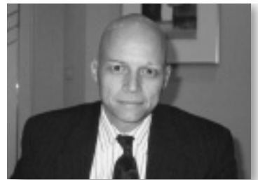
レゾネイト社CEOクリストファー・C・マリノ氏