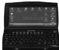
カラーモデルで540g、モノクロモデルで450gと軽量