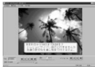
声と一緒に絵も送れる「WITH VOICE Multi」は9,800円で同時発売

URL http://www.bekkoame.or.jp/~with-voice/