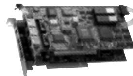
PCIスロットに差し込むだけで場所をとらないルーター

URL http://www.intranet.co.jp/products/r128/r128top.html