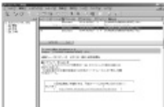
ウィンドウズ版の画面。プレビュー機能も追加された