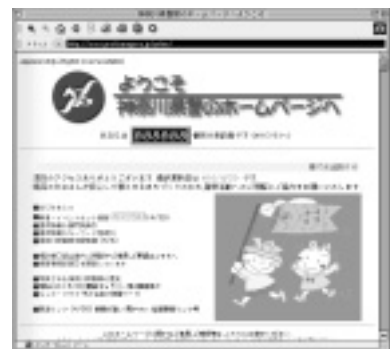
神奈川県警のホームページ