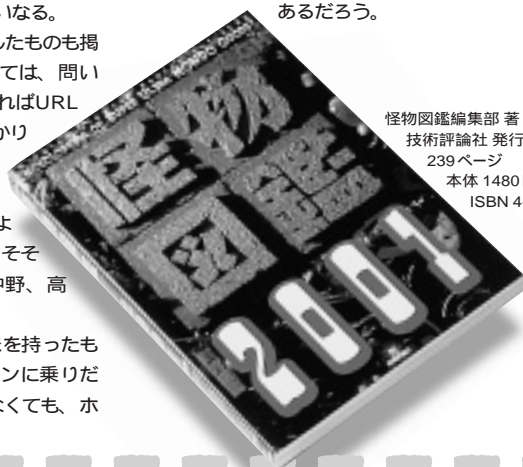
怪物図鑑編集部 著 技術評論社 発行 239ページ 本体 1480円 + 税 ISBN 4-7741-0536-8

ームページが存在するときがあるし、検索サービスで調べると、マニアやファン、利用者たちのページが見つかるかもしれない。そこから、濃い世界を覗いてみよう。普段読んでいる雑誌や書籍には書かれていない世界があるだろう。