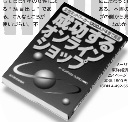
メーリングリスト「LIFE」編著 東洋経済新報社 発行 254ページ 本体 1500円 + 税 ISBN 4-492-55299-5

また、よく考えてみれば、消費者の要望を満たすショップがビジネス的に成功するショップとは限らない。売り上げを考えるならば、現在は女性の購買層より男性のほうを重視すべきだという意見もある。もっとも、消費者の要望に応えられないショップが成功するとは思えないので、成功するヒントは十分詰まっているはずだ。ただ、何かと女性にこだわっているのが気になるところである。本書の前提というべき「ショップの側から見たときの真の成功とは何なのか」が抜けているようだ。