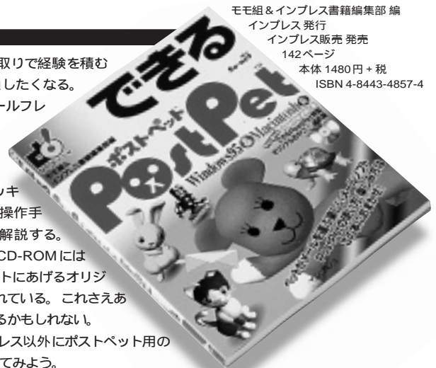
もも組 & インプレス書籍編集部 編 インプレス 発行 インプレス販売 発売 142ページ 本体 1480円 + 税 ISBN 4-8443-4857-4

仕事に使う電子メールアドレス以外にポストペット用のアドレスを取得して早速始めてみよう。