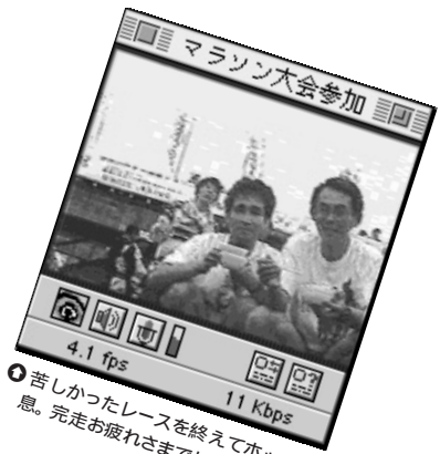
⑧ 苦しかったレースを終えてホッとした。完走お疲れさまでした。(?さん)