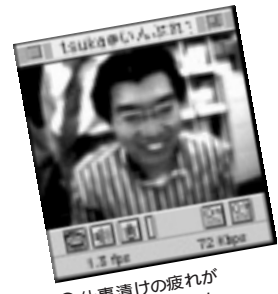
④ 仕事漬けの疲れがたままって、何もしてないのにニヤついてしまい、皆から「アブナイ奴」と言われています。