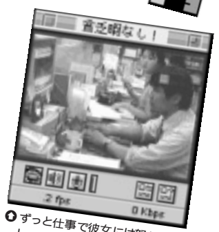
⑪ ずっと仕事で彼女には怒られるし...。みんなGWを満喫しやがって! うらやましいっただけありゃない!! (三宮さん)