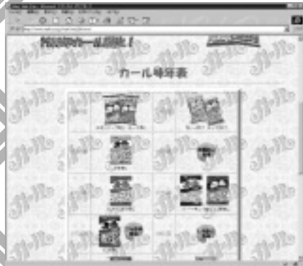
歴史年表もある、カールのホームページ。 URL http://www.meika.co.jp/karl/

「それにつけてもおやつはカール」でおなじみのスナック菓子にはちょっとした秘密あった! カールは1968年に誕生したお菓子なのだとか...。その謎はこのデジカメ写真が証明しています。でもカール食べながらネットサーフィンしていたら、キーボードやマウスがべちゃべちゃになってしまいます。キーボードカバーなどは必須ですね。 (MakotoN)