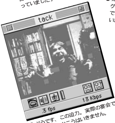
⑥ どうです、この迫力。実際の宴会では、なかなかこうはいけません。