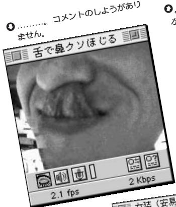
⑩ ..... コメントのしようがありません。