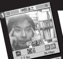
1 瞬間芸 2.7 fps 36 Kbps