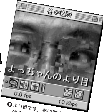
⑧ より目です。長時間やっていると目が回ってしまいます。