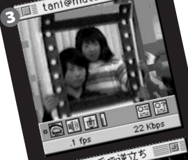
3 1 fps 22 Kbps