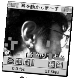
④ 嫁さんのイヤリングを付けて。5分で耳がっつてしまいました。