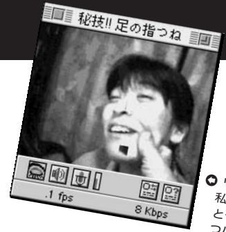
①「何をかくそう、私は足の指がとっても器用かつバワフル!」