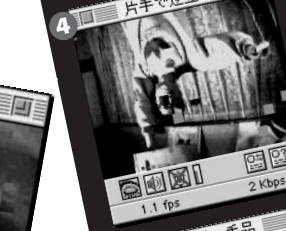
4 1.1 fps 2 Kbps