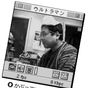
⑨ かぶっているのは懐かしの体育帽。娘さんのものだそうです。