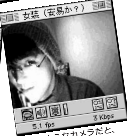
⑬ このようなカメラだと、ライティングで女性になりませます。