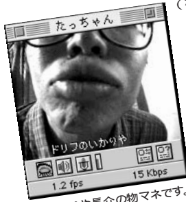
⑦ いかりや長介の物マネです。「おい〜っす!」