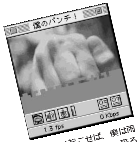
③「思い起こせば、僕は雨の日も風邪の日も、来る日も来る日も親指をねじっていました」