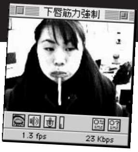
② 案外、こうした素朴な芸がウケたりするんですよ。