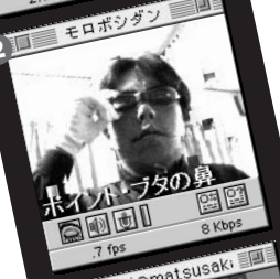
2 ホイップの鼻 7 fps 8 Kbps