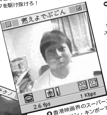
● 香港映画界のスーパースター サモ・ハン・キンポーです。