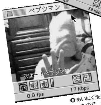
● あいにく全身タイツがなかったので、袋で代用。