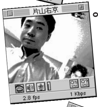
● I氏はインプレス「PC-Watch」の片山右京、ネットワークを駆け抜ける!