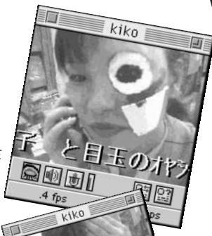
● 頭の左半分は目玉親父、右半分は南野陽子。