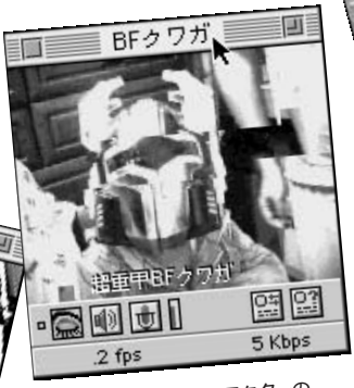
● 最近アニメのキャラクターの人氣がすごいみたいですね。