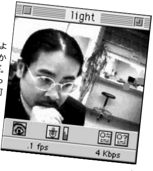
2 PRの内容がよく分からなかったのですが、モニターをじっと見つめて何を...