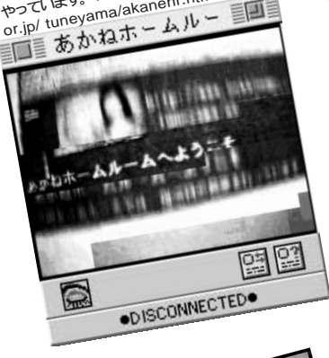
3 常山さんが6月にネット上に開講した「あかねホームルーム」では国語の授業をやっています。http://www.bekkoame.or.jp/tuneyama/akanehr.html