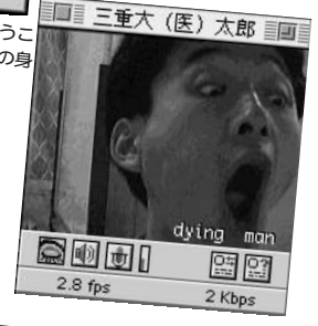
10 dying (瀕死の) man ということですが、三重大太郎さんの身に何があったんでしょうか？