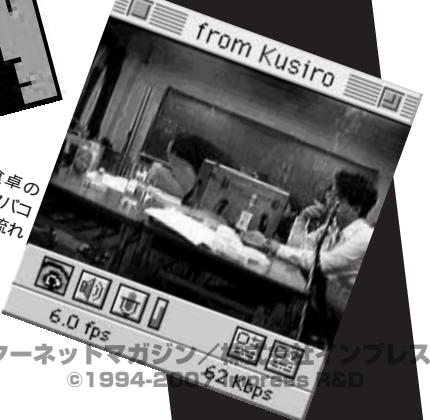
5 なにげない食卓の風景ですが、タバコの煙がきれいに流れていました。