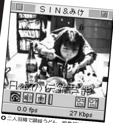
① 二人羽織で讃岐うどん。編集部はバカウケでした。このあと彼女は日本酒をくいつ。