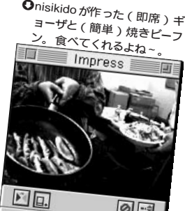
① nisikidoが作った(即席)キョーザと(簡単)焼きビーフン。食べてくれるよね。