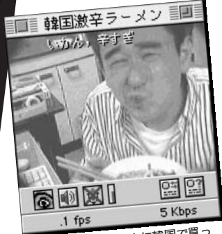
① ゴールデンウィークに韓国で買ってきました。辛くて頭がぼーっとします (nagaiさん)