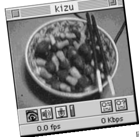
① ポッキーに「きのこの森」でしようか。つましい食事、というよりお酒のおつまみ。