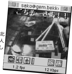
① 北海道の鮭弁当 + 北海道の生ビール。1人暮らしても楽しめました (迫田輝久さん)