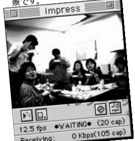
① コピー機の前の「食卓」いつもの編集部の夕ごはんの風景です。