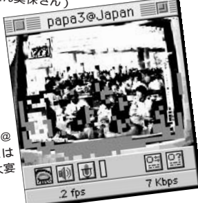
① 毎月登場のPapa3@Japanさん。映像はよく見えないけど大変会ですか?