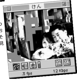
① お二人で仲むつまじく食べておられますが、それが何なのか見えません。