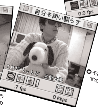
●それでも野性を持って余すのでしょうか(?)