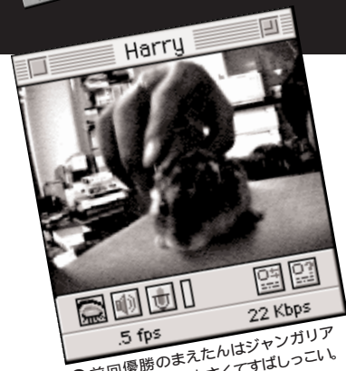
●前回優勝のまえたんはジャンガリアンハムスター。小さくてすばしっこい。