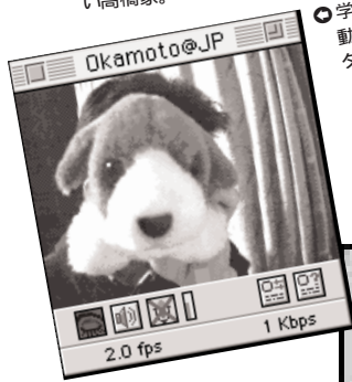
●学生の一人暮らしでは動物は飼えないのでダグ君でご勘弁を。