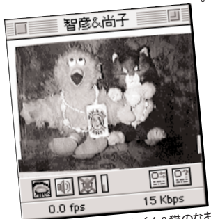
●ビックバードのともくん&猫のなおちゃん。アパートなので本物が飼えない高橋家。