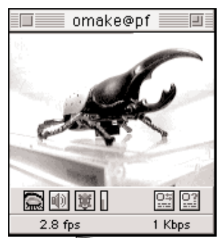
●しなやかな肢体のかぶと虫は残念ながらオマケである。