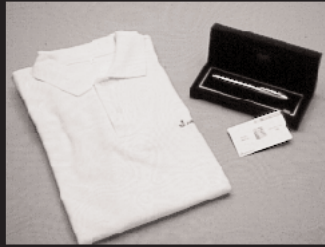
I-1: ポロシャツ 3名様 I-2: クロスボール ペン 1名様 I-3: テレホンカード 5名様 提供: 株式会社ジャストシステム