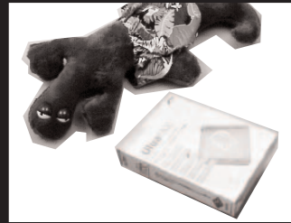
O-1: カメレオンぬいぐるみ 4名様 O-2: ゼオン フトウルトラファックス [Windows対応] 3名様 提供: 住友金属工業株式会社