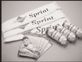
M-1: アメリカオンライン 4名様 M-2: テニスボール+ タオル 3名様 提供: 日本スプリント株式会社