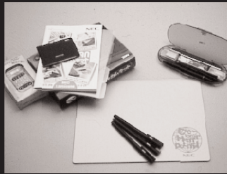
N-1: PC-VANウエルカムキット 10名様 N-2: マウスパッド N-3: スーパ-文具セット N-4: 三色水性ペン 各5名様 提供: 日本電気株式会社