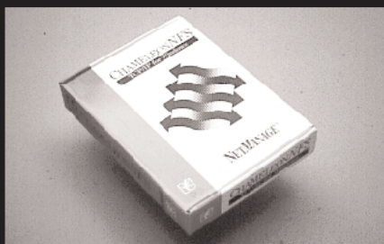
M-3 : CHAMELEON TCP/IP for Windows 1名様 提供 : 株式会社フォーバレクリエイティブ Windows専用TCP/IP接続ソフト