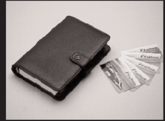
L-1: システム手帳 4名様 L-2: テレホンカード 10名様 提供: 株式会社フジクラ