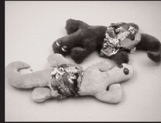
K-1: カメレオンぬいぐるみ 2名様 提供: 株式会社フォーバルクリエイティブ