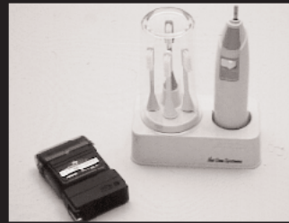
C-1: パーソナルチタン電気シェーバー 3名様 C-2: 日立電動歯ブラシ 2名様 提供: ネットワシシステムズ株式会社