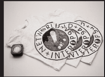
D-1: 世界時計 10名様 D-2: Tシャツ 4名様 提供: ノベル株式会社