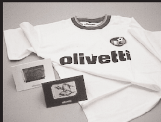
Q-1: Tシャツ 5名様 Q-2: テレホンカード 10名様 提供: 日本オリベッティ株式会社