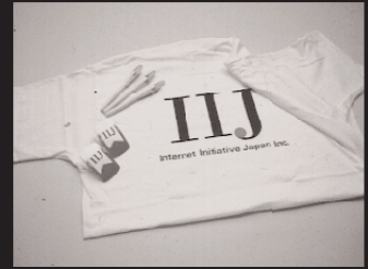
H-1: Tシャツ3名様 H-2: メモクリップ 10名様 H-3: ロゴリベン 10名様 提供: 株式会社インターネットイニシアティブ