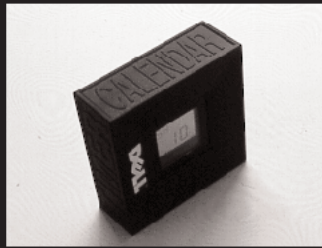
B-1: 多機能時計 5名様 提供: デルコンピュータ株式会社