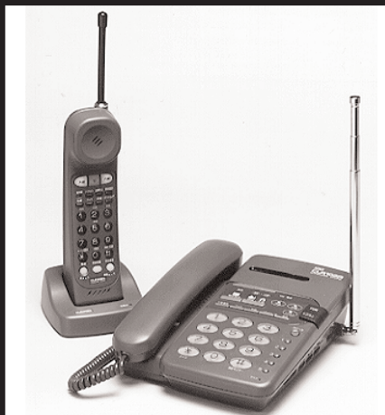
M-2 : コードレス電話 1名様 提供 : 株式会社大興電機製作所 CLR102A 強力小電力形 / 盗聴防止 / 留守番電話機能付

読者モニターを募集します。モニターの選定は、製品を使用できる方に限らせていただきます。なお、モニターになられた方には、後日、使用レポートを提出していただきます。