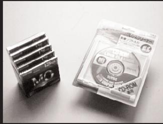
E-1: クリーニングCD 5名様 E-2: MOディスク 5名様 提供: マクセルメディアサービス株式会社