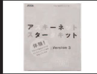
G-1: スターキット 3名様 提供: 株式会社アスキー