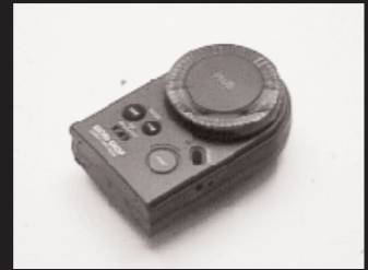
P-1: プラスワードショップ 5名様 提供: 第一紙業株式会社