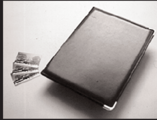
J-1: A4書類ケース 3名様 J-2: テレホンカード 3名様 提供: 株式会社ソリトンシステムズ