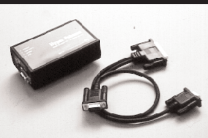
M-4 : MICROCOM MICROPORTE 2名様 提供 : 株式会社NTT PCコミュニケーションズ MNPクラス10対応モデムHyper Pockemo