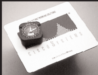
R-1: 世界時計 5名様 R-2: マウスパッド 10名様 提供: 日本シスコシステムズ株式会社