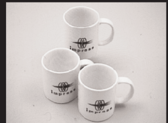
T-1: インプレスマグカップ 10名様 提供: 株式会社インプレス