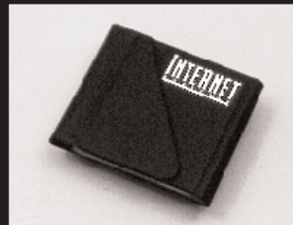
S-1: インターネットマガジンロゴ入りCD ケース 10名様 提供: 株式会社インプレス