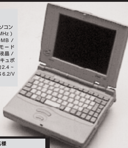
M-1 : 東芝 DynaBook SS 1名様 提供 : 株式会社インプレス

SS4251WW 標準価格298,000円 B5ファイルサイズ・サブノートパソコン CPU:SL Enhanced i486SX (25MHz) / メモリ:4MB / 内蔵HDD:120MB / 3.5"着脱式内蔵FDD × 1 (3モード 式) / ディスプレイ:白黒64階調液晶/ ポインティングデバイスとしてアキュボ イント採用 / バッテリー駆動時間:約2.4 - 4時間 / Windows 3.1 & MS-DOS 6.2/V をインストール済み