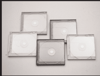
A-1: CD キャリー5色セット 50名様 提供: エフティ技研株式会社